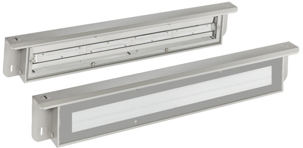
Abbildung oben mit sichtbarer LED, Abbildung unten mit satinierter Folie keine Lichtpunkte sichtbar, DB konform PSH-48910.

Ortsfeste Beleuchtung von Arbeitsgruben in Bahn- und Verkehrsbetrieben, KFZ-Werkstätten und Industrie-, Gewerbe- und Handwerksbetrieben mit staub- und schmutzhaltiger Atmosphäre.